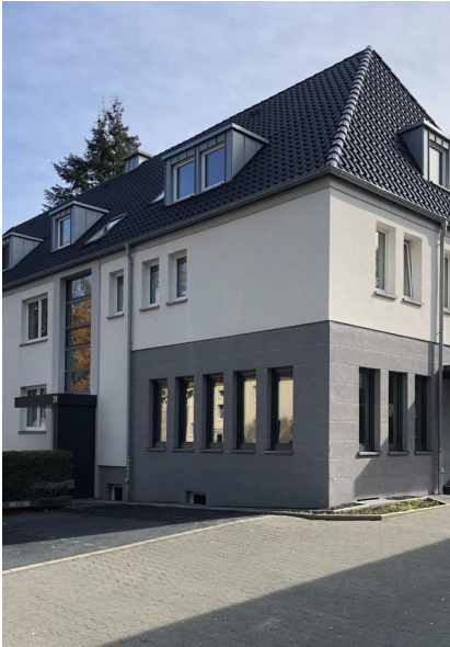
Parkstr. 31, 59425 Unna