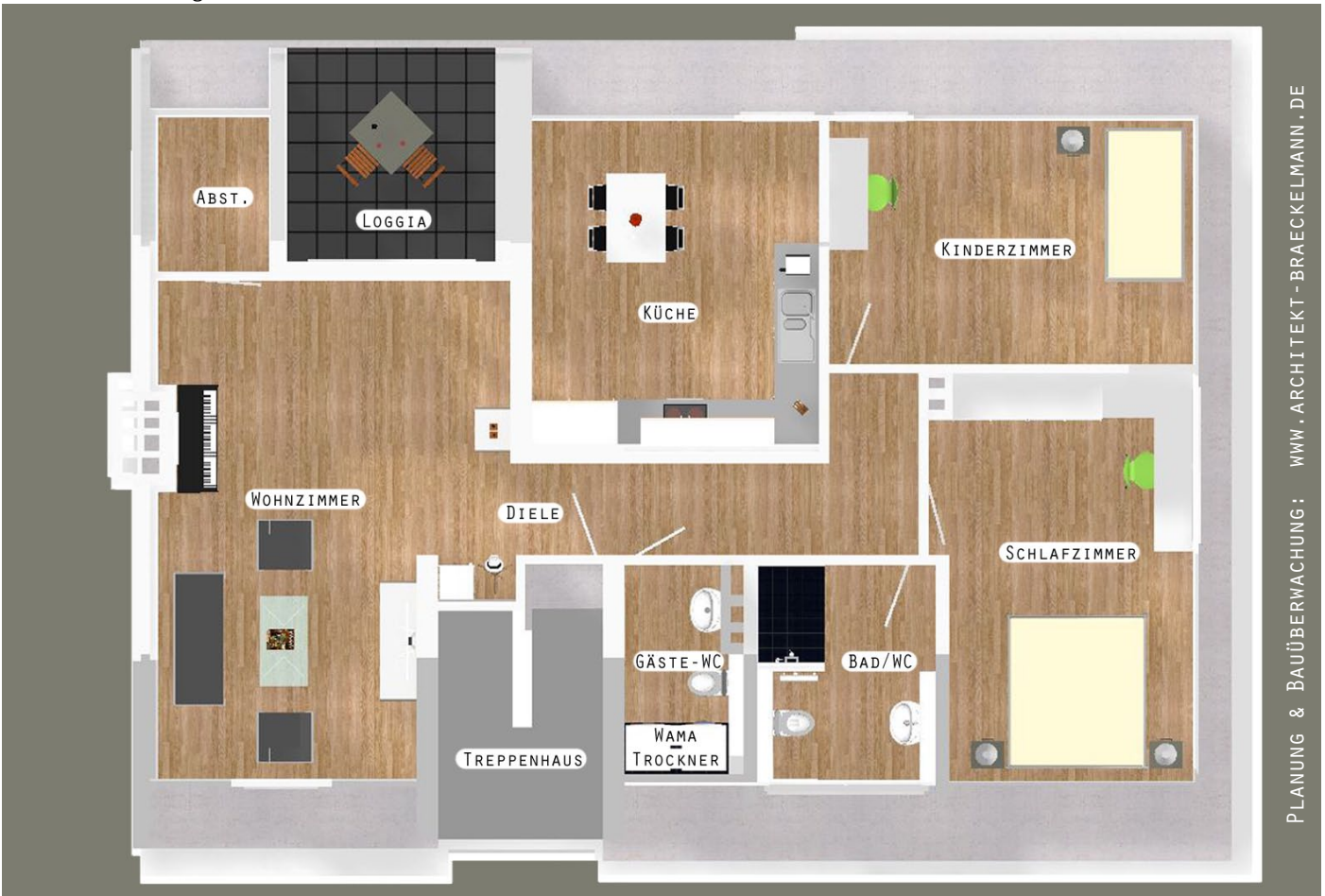
Grundriss Wohnung DG