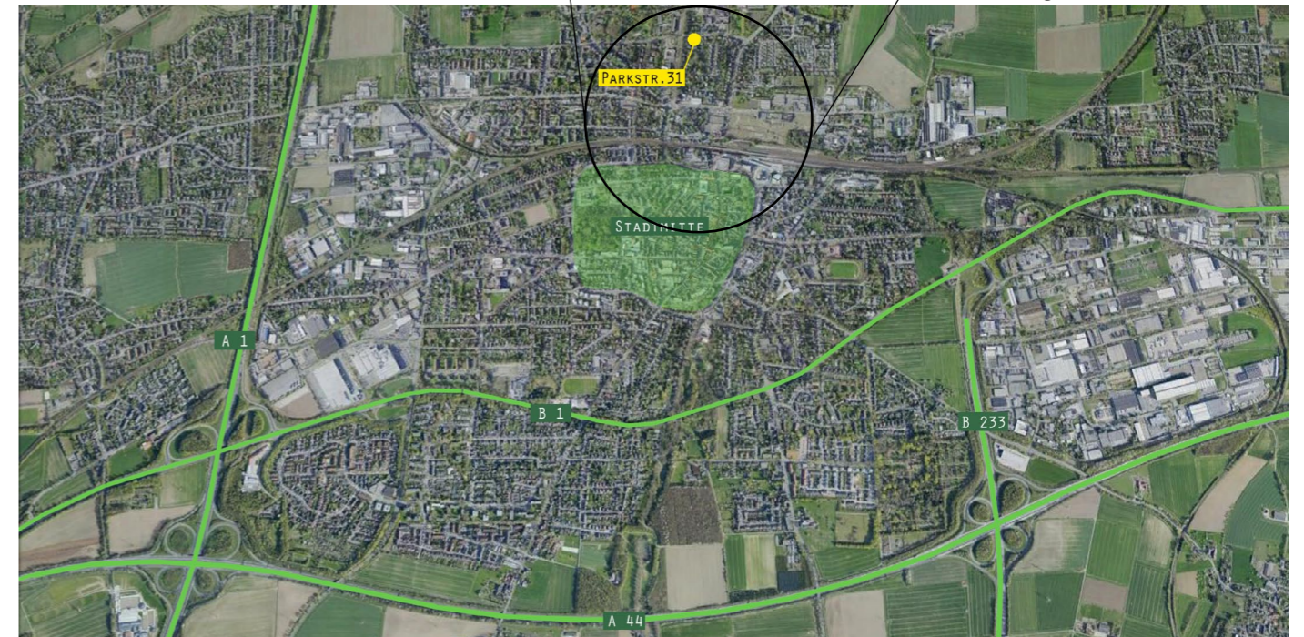
Lage des Gebäudes in Unna