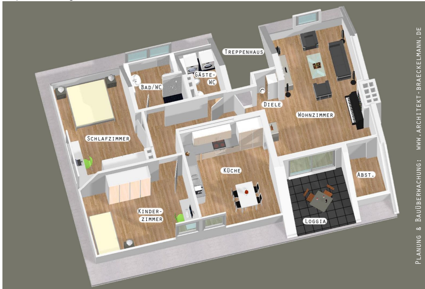
Perspektive Wohnung DG

PLANUNG & BAUÜBERWACHUNG: WWW.ARCHITEKT-BRAECKELMANN.DE