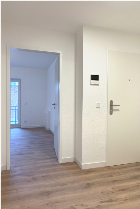
Diele (Blick zur Küche)