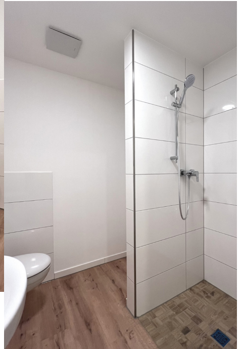
Dusche & WAMA-Platz