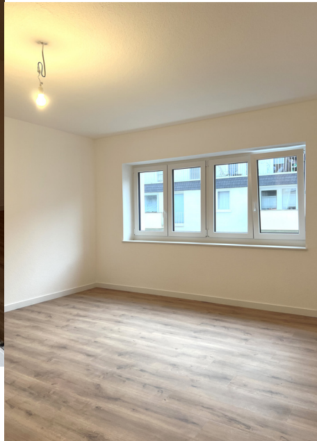
Wohn- & Schlafzimmer